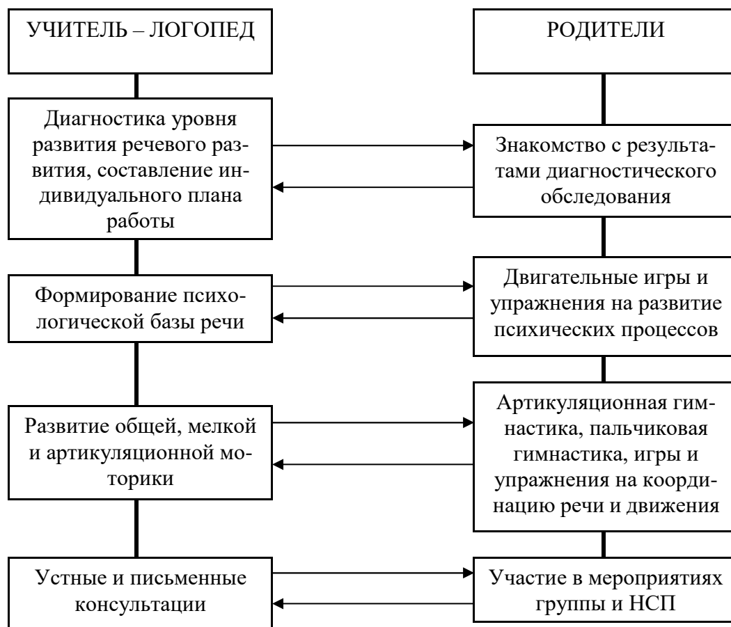
Модель взаимодействия учителя – логопеда с родителями

Без постоянного и тесного взаимодействия с семьями воспитанников коррекционная логопедическая работа будет не полной и недостаточно эффективной. Поэтому интеграция детского сада и семьи – одно из основных условий работы учителя-логопеда. Модель взаимодействия с семьями детей, имеющими нарушения речи, представлена на схеме.