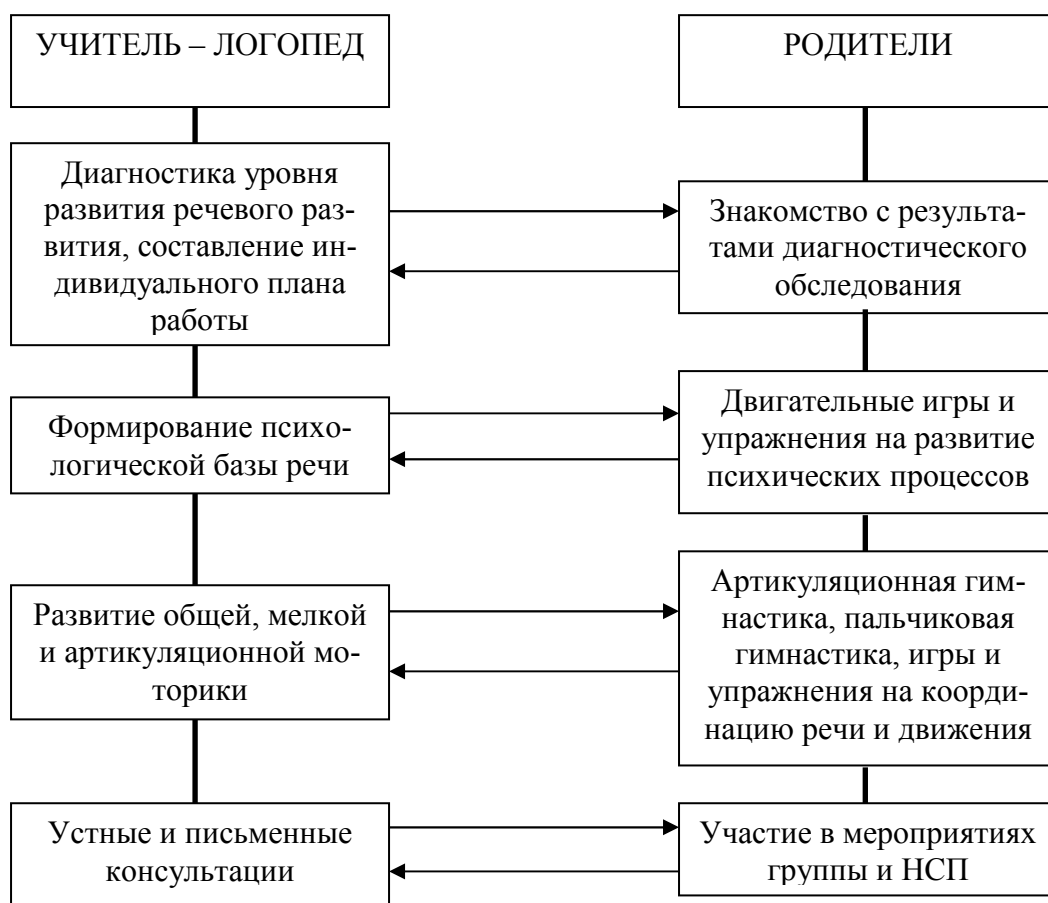
Модель взаимодействия учителя – логопеда с родителями

Без постоянного и тесного взаимодействия с семьями воспитанников коррекционная логопедическая работа будет не полной и недостаточно эффективной. Поэтому интеграция детского сада и семьи – одно из основных условий работы учителя-логопеда. Модель взаимодействия с семьями детей, имеющими нарушения речи, представлена на схеме.