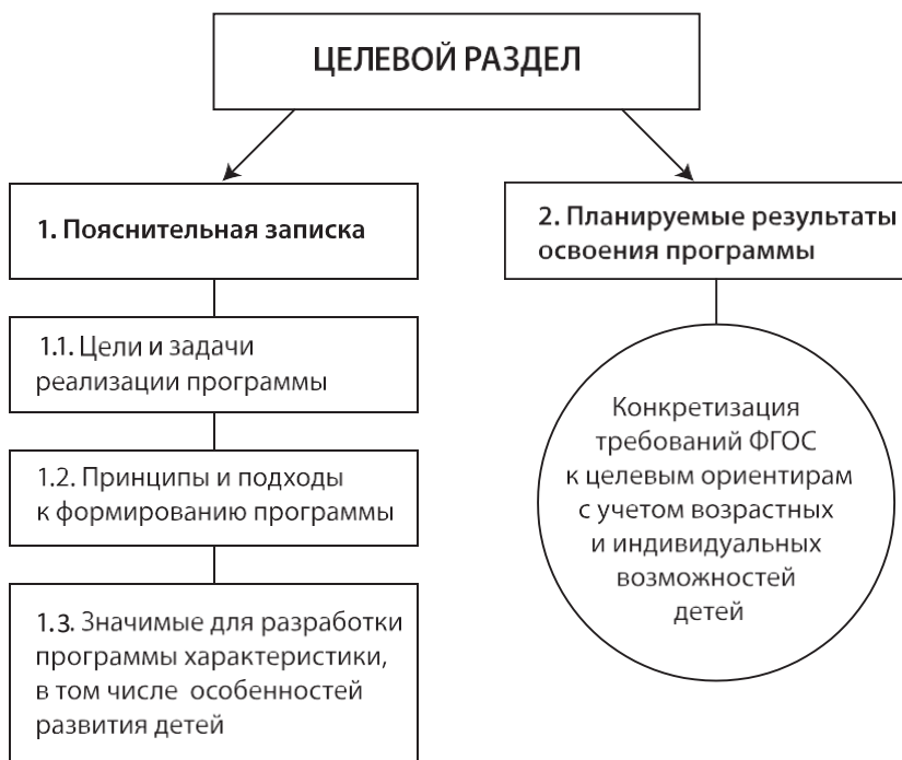
Схема 1. Структура целевого раздела программы

Начинать проектирование целевого раздела ООП ДО целесообразно с конца — с уточнения планируемых результатов ее освоения ребенком , установления их соответствия ФГОС. Ориентиром для разработчиков программы являются планируемые результаты освоения программы, представленные в ФГОС и в тексте примерной программы.